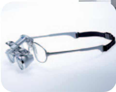
◀ EyeMag Smart

Carl Zeiss spol. s.r.o. Radlická 14/3201 150 00 Praha 5 tel.: +420 233 101 221 fax: +420 233 101 223 e-mail: info.med.cz@zeiss.com www.zeiss.cz