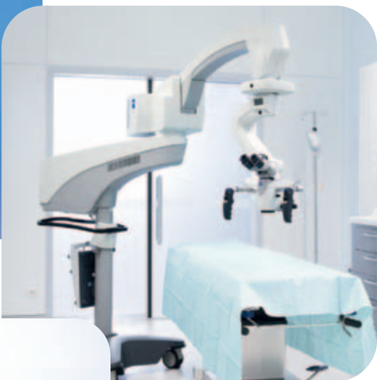
OPMI Vario 700 ▶