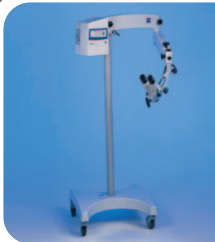
◀ OPMI Pico ENT