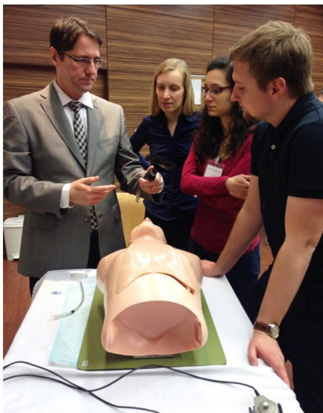
Intubace a flexibilní bronchoskopie