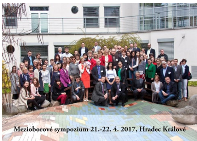
Mezioborové sympozium 21.-22. 4. 2017, Hradec Králové