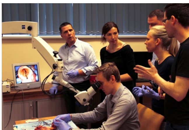
Nácvik laterofixace hlasivky