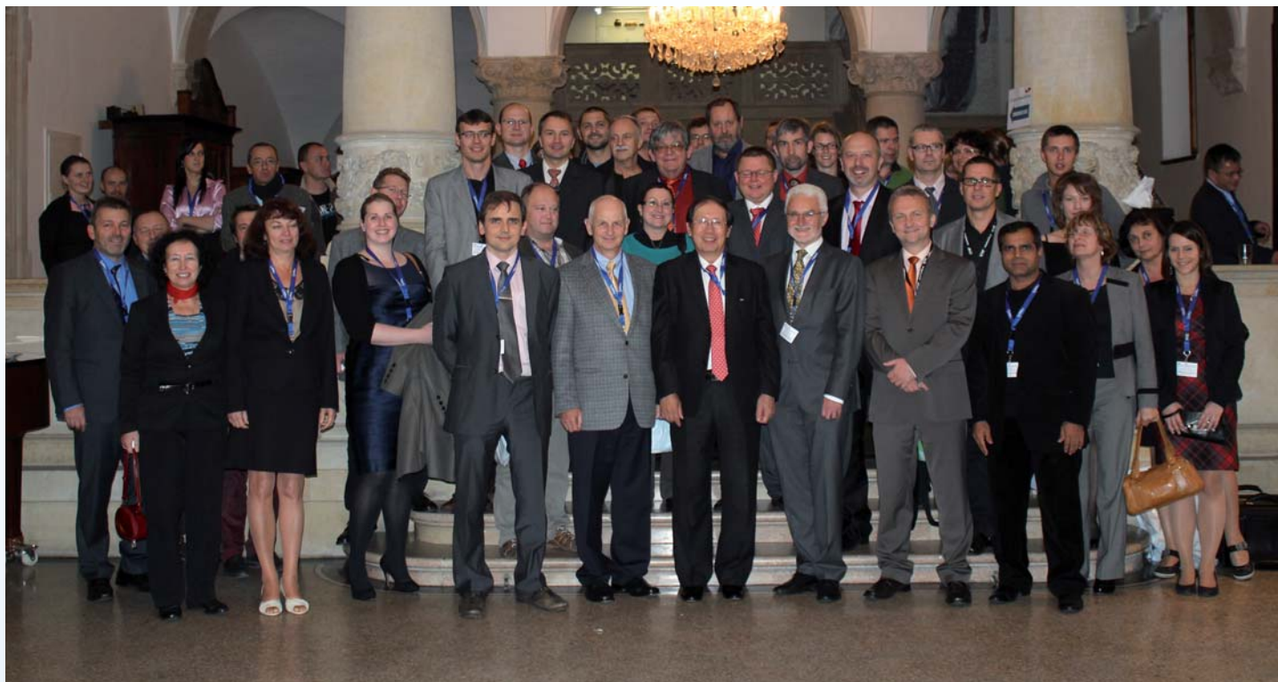
Účastníci 12. česko-německých ORL dní v Liberci